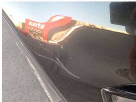
Bouclier avant (Rayure)